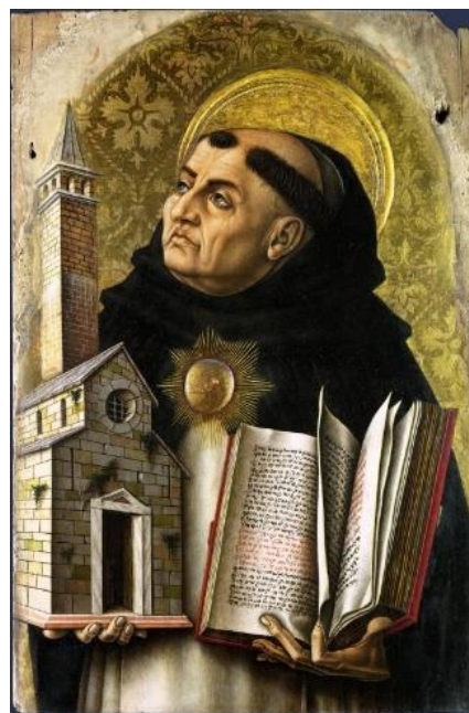
Tomáš Akvinský (* 1225 – † 7. 3. 1274)

Loučím se se čtenáři citátem Tomáše Akvinského, katolického filozofa a teologa scholastické kultury ze 13. století.